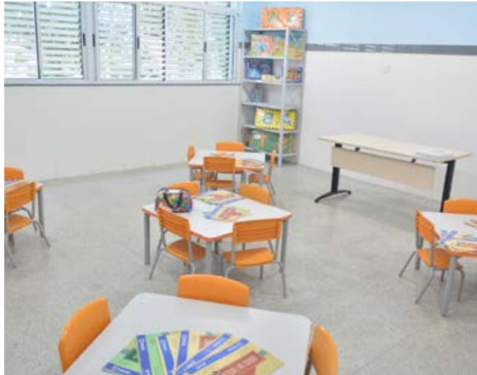
Escola Mário Altenfelder – Salvador – BA Mário Altenfelder school