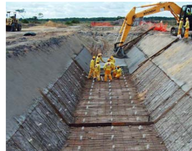
Canal de Caracará – RR Drainage canal