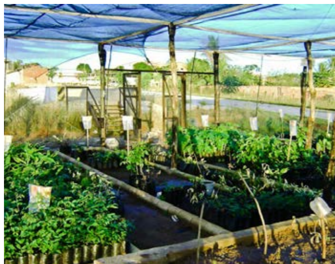
Viveiro de espécies nativas – Coronel João Sá – BA Hotbed of native species