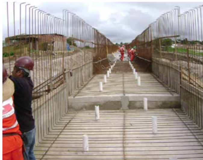
Canal de Bondocongo – Campina Grande – PB Drainage canal