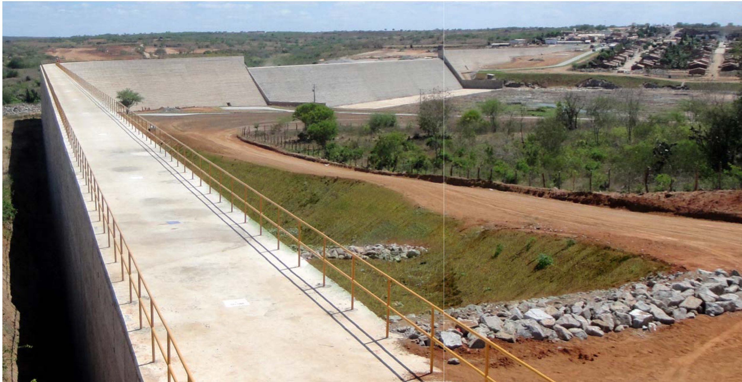
Barragem de Gasparino - Coronel João Sá - BA Gasparino Dam