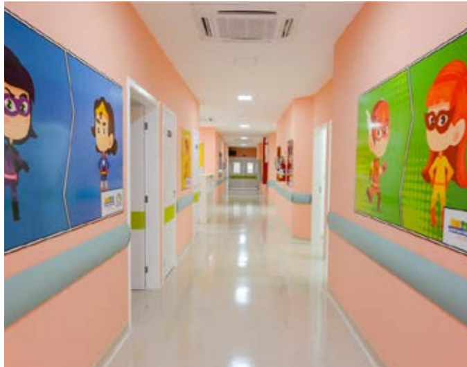
Hospital da Criança – Boa Vista – RR Children's Hospital