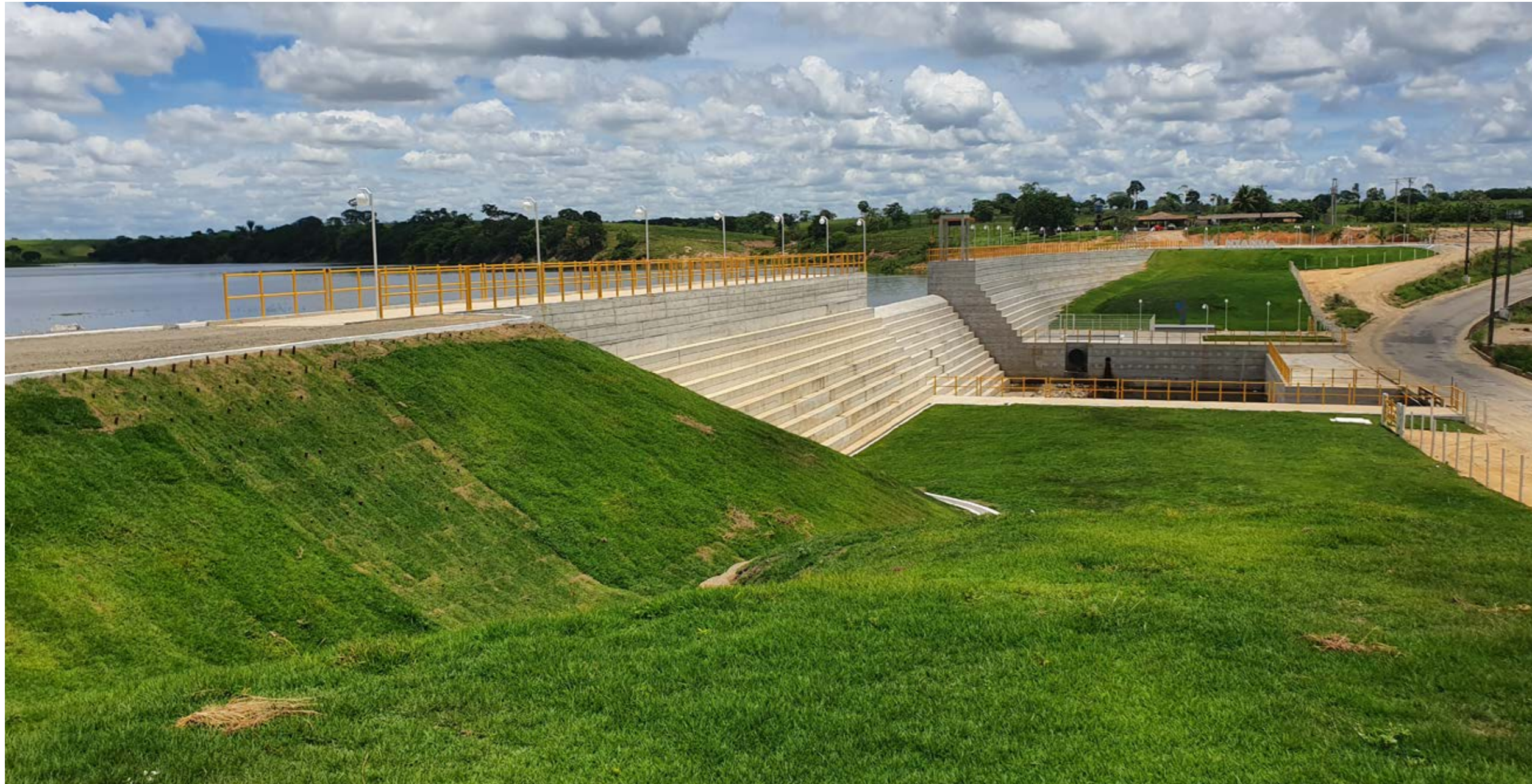
Barragem de Tutu Reuter – Montanha – ES Tutu Reuter Dam