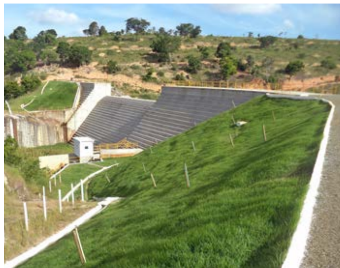
Barragem Eng. Valter Matielo – Pinheiros, Boa Esperança – ES Eng. Valter Matielo Dam