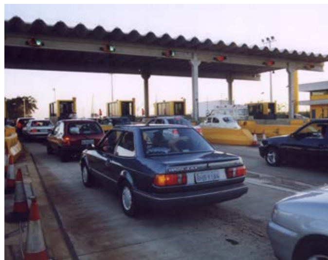
Praça de pedágio – Concessionaria Autovias – SP Toll Bridge