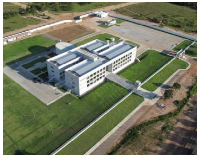
Sede da Superintendência da Polícia Federal – Boa Vista – RR Headquarters of the Federal Police Superintendence