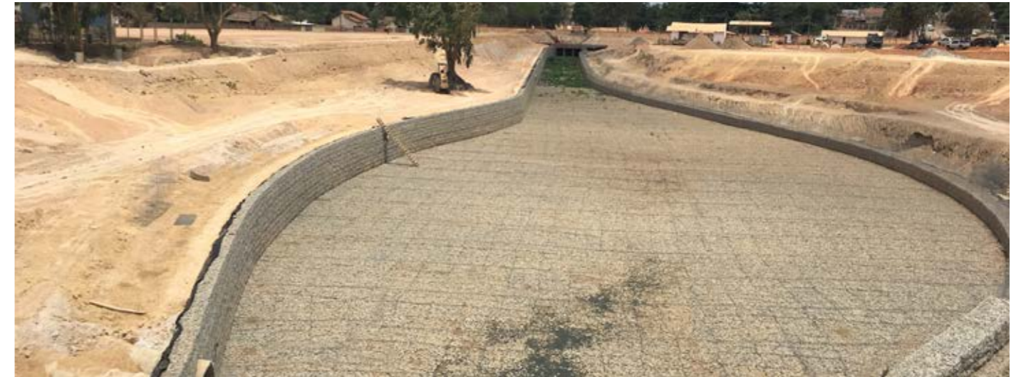
Canal Caxangá – Boa Vista – RR Drainage canal