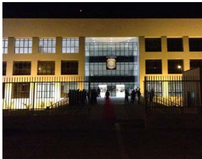
Sede da Superintendência da Polícia Federal – Boa Vista – RR Headquarters of the Federal Police Superintendence

The company executes a variety of projects in order to fulfill a wide range of demands.