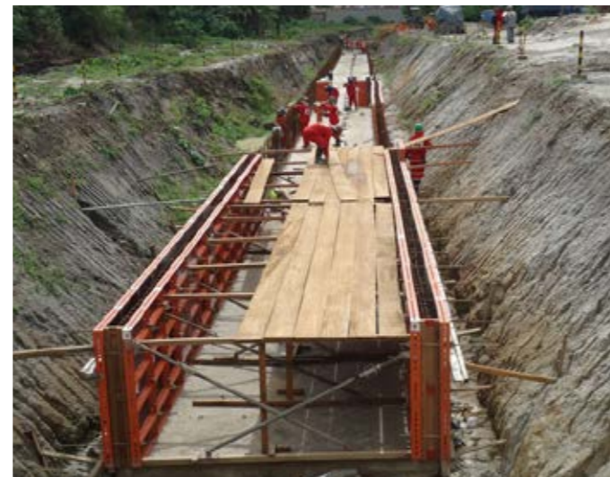
Canal de Mutum – Santo Antônio de Jesus – BA Drainage canal