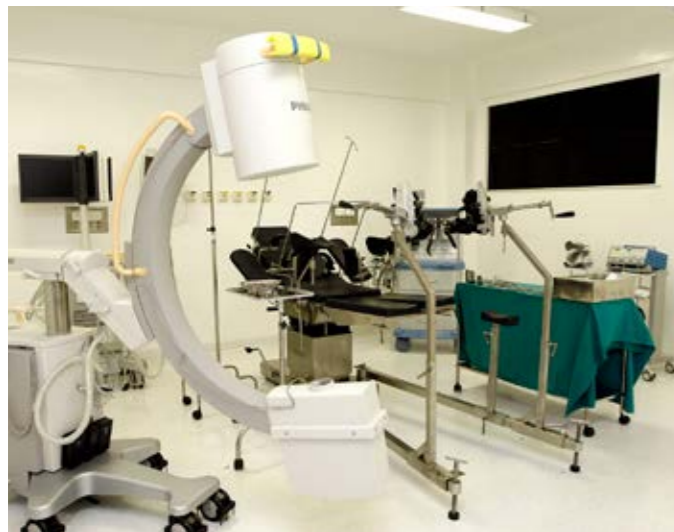
Hospital Regional de Santo Antônio de Jesus – BA Regional Public Hospital

AG Service has an extensive experience in the construction of hospitals and public facilities.