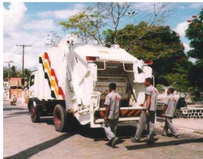
1 - Coleta de Lixo - Catu - BA 2 - Aterro Sanitário - Boa Vista - RR

The proper collection and destination given to solid waste have gained emphasis in the global context due to the commitment with social liability. Which is also a priority for AG Service.