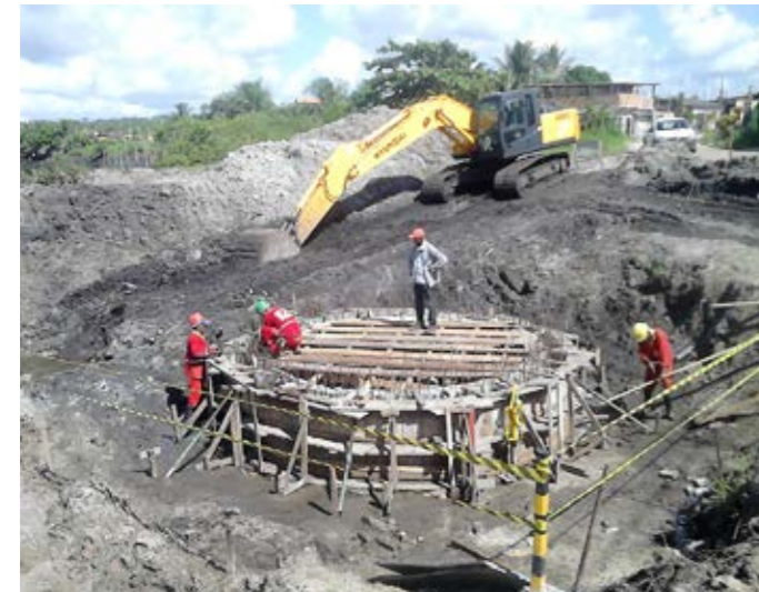
Estação Elevatória de Esgoto – Valença – BA Sewage pump station