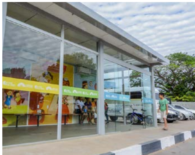
Ponto de ônibus climatizado – Boa Vista – RR Air-conditioned bus stop